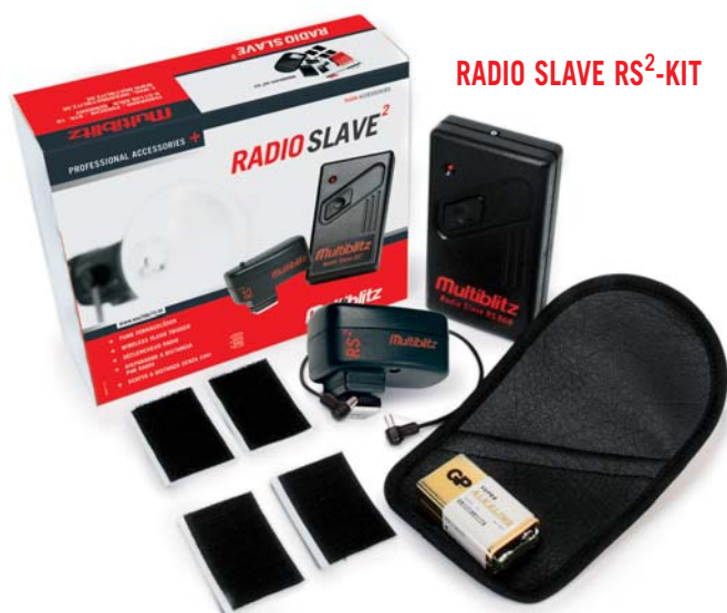
RADIO SLAVE RS 2 -KIT

Emisor y receptor se pueden adquirir también por separado.